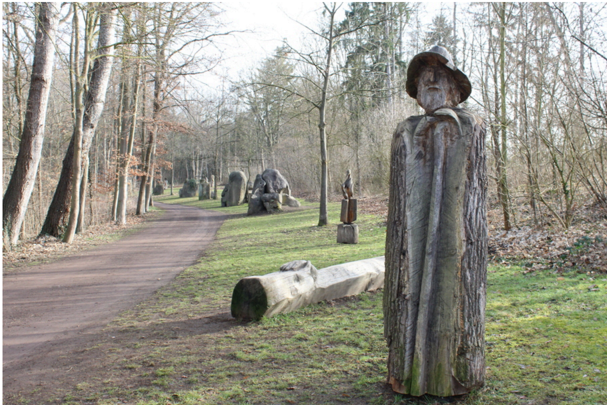
Rundweg Nettepark