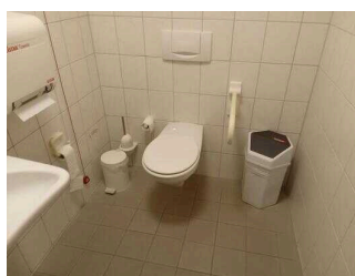
WC für Menschen mit Behinderung im Vulkanpark Zentrum