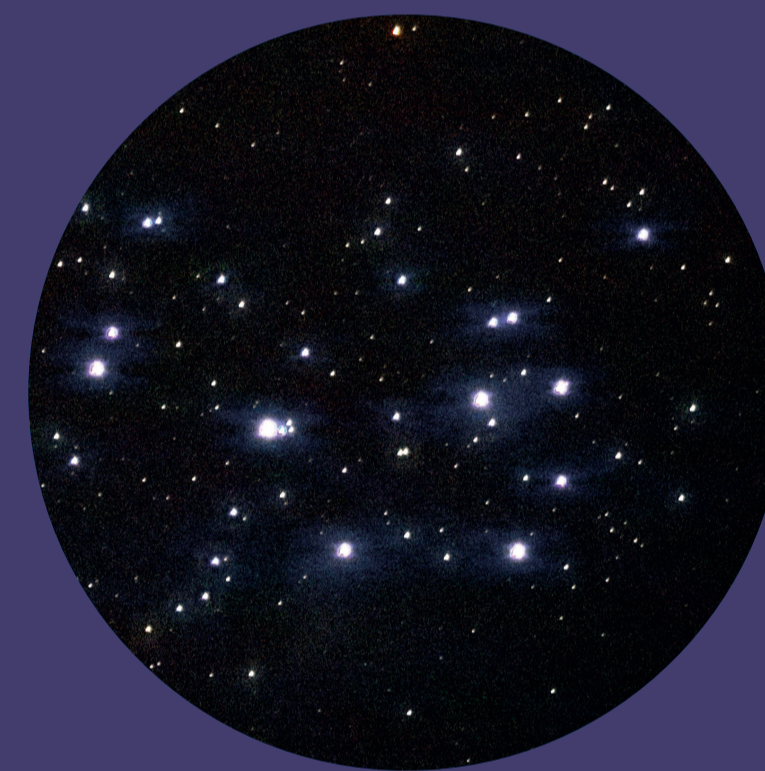
... und durch das Fernglas betrachtet.